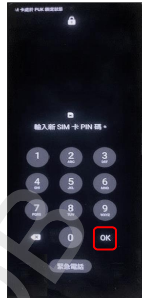
3. 輸入新 SIM 卡 PIN 碼 →OK