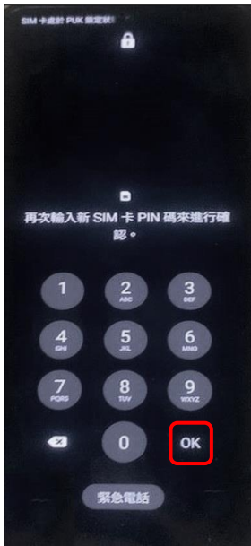
4. 再次輸入新 SIM 卡 PIN 碼→OK