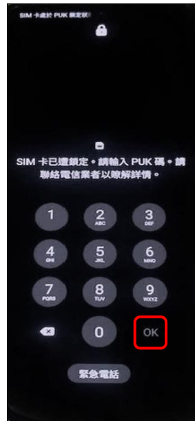
2. 請輸入 8 位數 PUK 碼 →OK