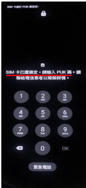
1. SIM 卡已遭鎖定。 請輸入 PUK 碼