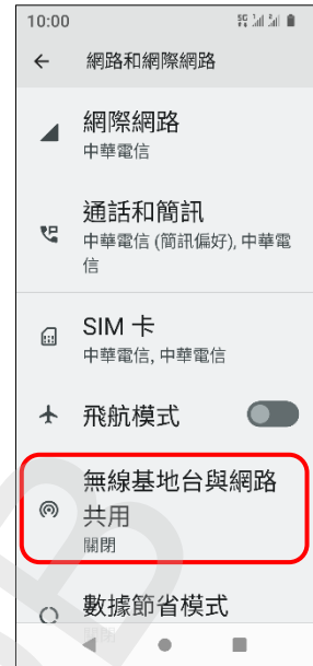
3.無線基地台與網路共用