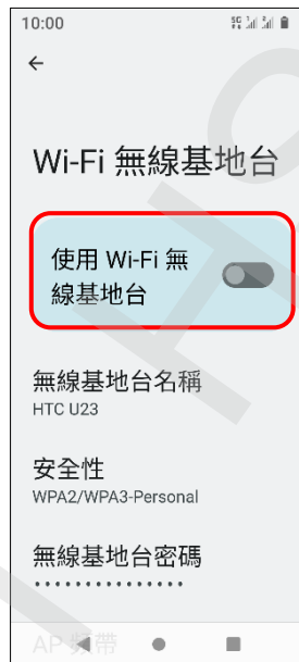
5.使用 Wi-Fi 無線基地台 →開啟