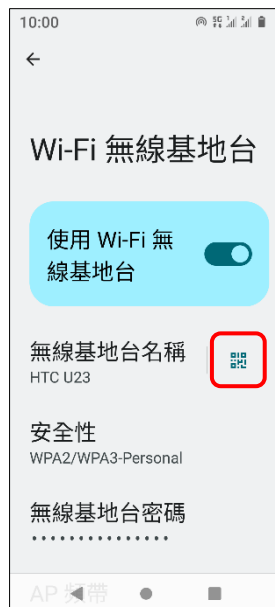
6.點選 QR 碼