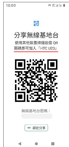
7.掃描 QR 圖碼即可連接