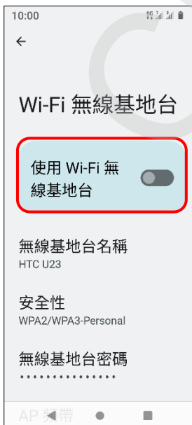
5.使用 Wi-Fi 無線基地台 →開啟