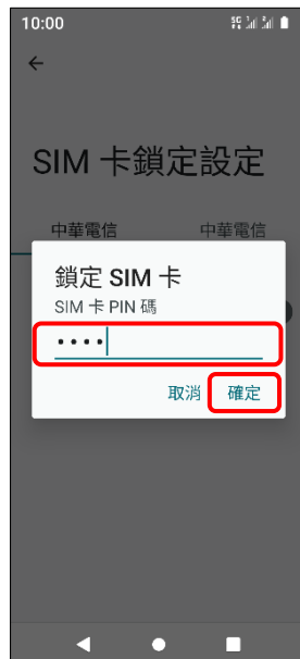
7.輸入 SIM 卡 PIN 碼 →確定