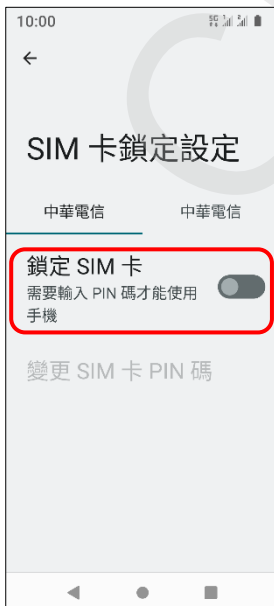
6.鎖定 SIM 卡→開啟