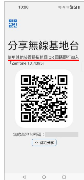
6.掃描 QR 圖碼即可連線