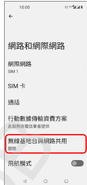
3.無線基地台與網路共用