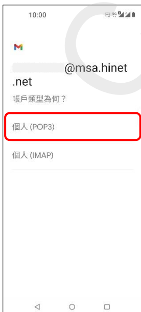
7. 個人 (POP3)