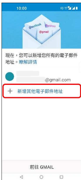
4. + 新增其他電子郵件地址