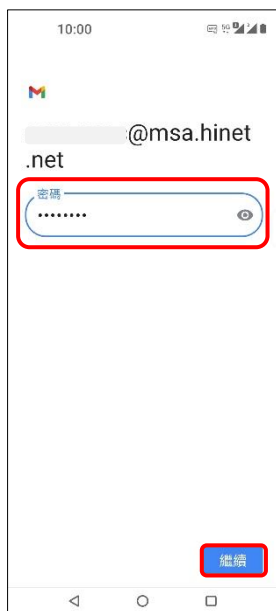
8. 輸入郵件密碼 → 繼續