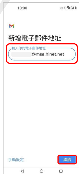
6. 新增電子郵件地址 → 繼續