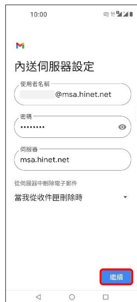
9. 內送伺服器 → 繼續