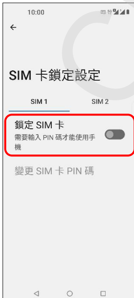
5.鎖定 SIM 卡→開啟