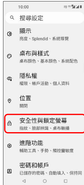
2.安全性與鎖定螢幕