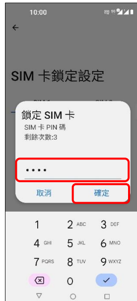
6.輸入 SIM 卡 PIN 碼 →確定