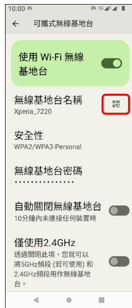
7. 點擊 QR 圖碼