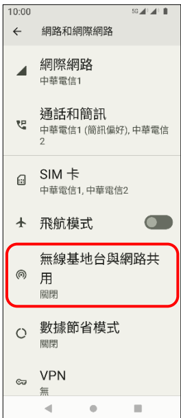
4.無線基地台與網路共用