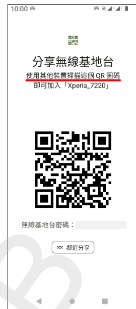
8. 掃描 QR 圖碼即可連線