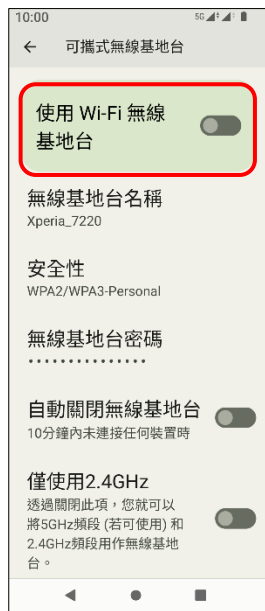
6. 使用 Wi-Fi 無線基地台 → 開啟