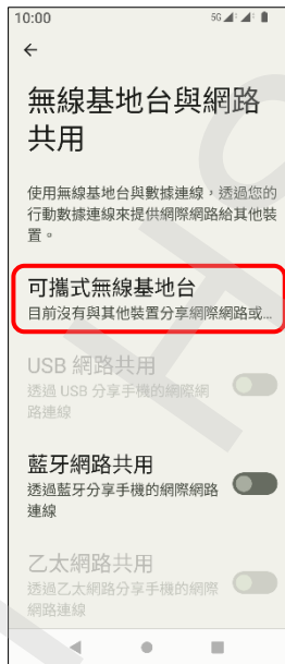
5.可攜式無線基地台