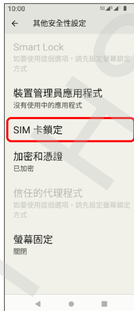
5. SIM 卡鎖定