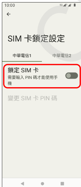
7. 鎖定 SIM 卡 → 開啟