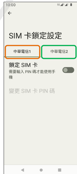
6. 選擇 SIM1/SIM2