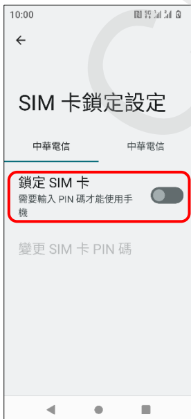
6.鎖定 SIM 卡→開啟