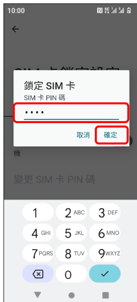
7.輸入 SIM 卡 PIN 碼 →確定