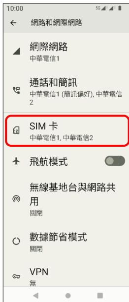
4. SIM 卡