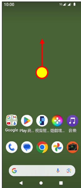
1. 往上滑進入應用程式