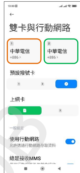
3. 選擇 SIM1/SIM2