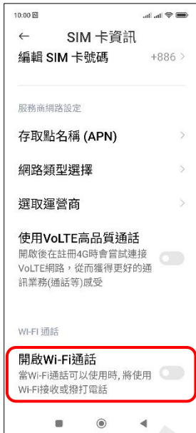
4. 開啟 Wi-Fi 通話 → 開啟