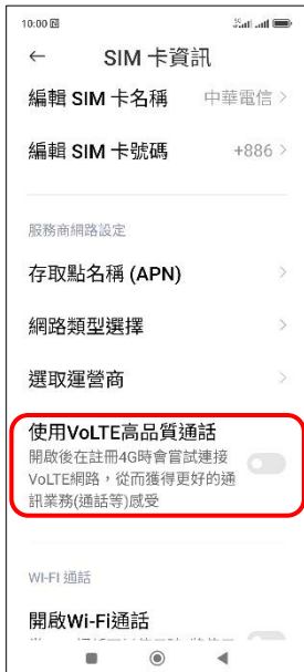
4. 使用 VoLTE 高品質通話 → 開啟