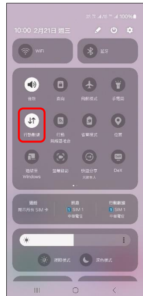
3.點 ⏴ → 行動數據 關