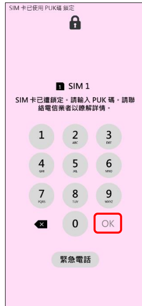
2.請輸入 8 位數 PUK 碼 →OK