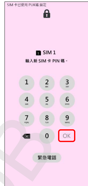
3. 輸入新 SIM 卡 PIN 碼 →OK