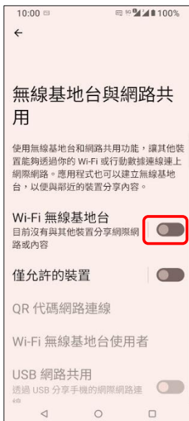
4.Wi-Fi 無線基地台→開啟 個人熱點 QR 分享