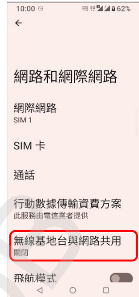
3.無線基地台與網路共用