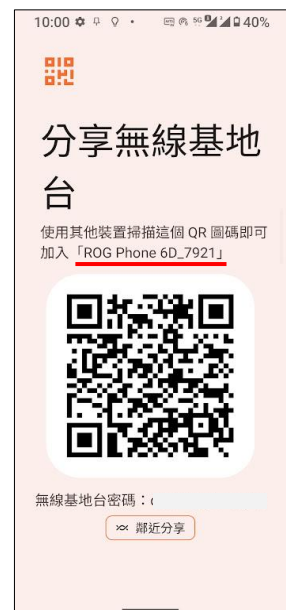
6.掃描 QR 圖碼即可連線