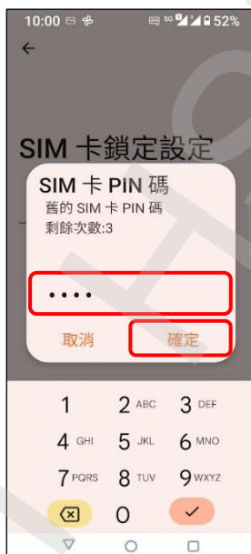
5. 輸入舊的 SIM 卡 PIN 碼 → 確定