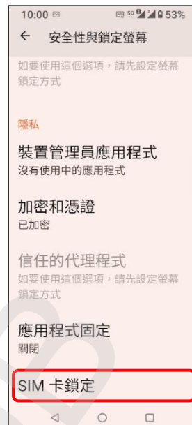
3. SIM 卡鎖定