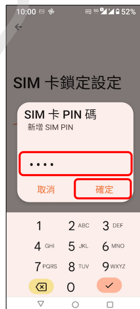
6. 新增 SIM 卡 PIN 碼 → 確定