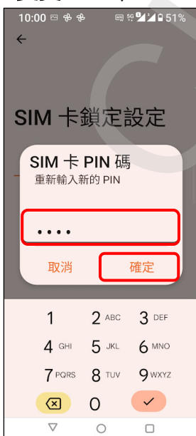
7. 重新輸入新的 PIN 碼 → 確定