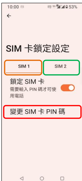
4. 選擇 SIM1/SIM2 → 變更 SIM 卡 PIN 碼