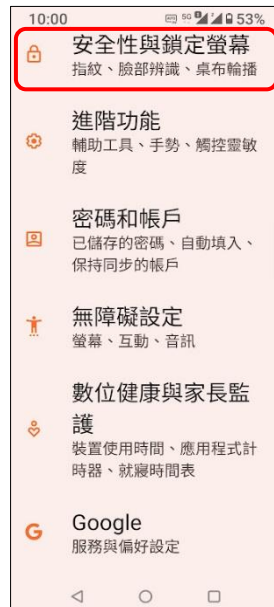
2.安全性與鎖定螢幕