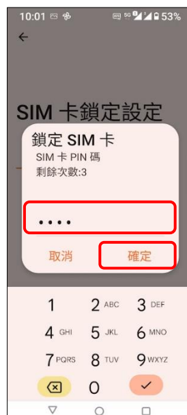
6.輸入 SIM 卡 PIN 碼 →確定