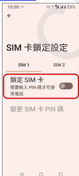
5.鎖定 SIM 卡→開啟