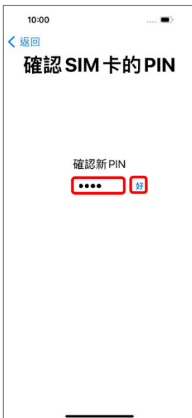
4. 確認新 PIN → 好