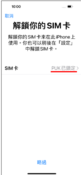
1. PIN 輸入 3 次錯誤 要求輸入 PUK

※輸入客服人員提供的 PUK 碼，可以有 10 次 機會，若 10 次錯誤 SIM 卡就會作廢