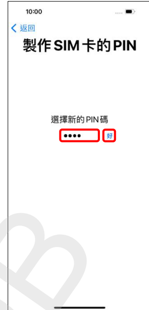
3. 選擇新的 PIN 碼 → 好