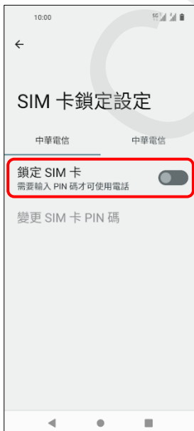
5.鎖定 SIM 卡→開啟