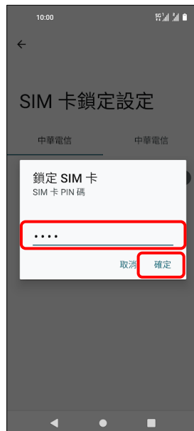
6.輸入 SIM 卡 PIN 碼 →確定