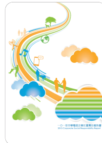
一〇一年 企業社會責任報告書 2013年8月出版