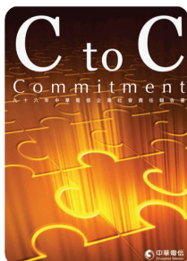
九十六年 企業社會責任報告書 2008年5月出版