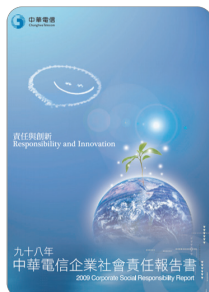
九十八年 中華電信企業社會責任報告書 2010年8月出版