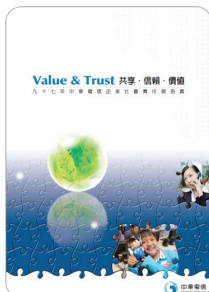
九十七年 企業社會責任報告書 2009年9月出版