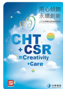
一〇〇年 企業社會責任報告書 2012年8月出版