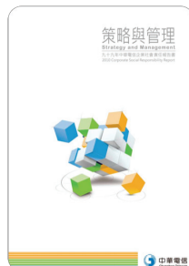
九十九年 企業社會責任報告書 2012年2月出版