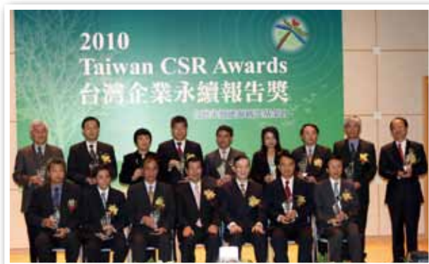
蕭副總統與呂董事長合影留念。