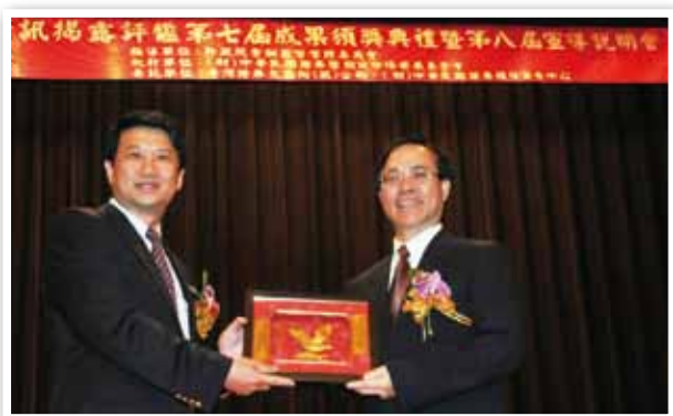
我們的公司資訊揭露連續五年獲金管會評鑑為最高之A+級。

繼《上市上櫃公司企業社會責任實務守則》推出後，證交所對加強上市公司之企業社會責任資訊揭露，也有進一步的發展方向，證交所將以目前全球報告倡議組織（Global Reporting Initiative，簡稱GRI）所提出之永續性報告書第三代綱領（the third generation of GRI's Sustainability Reporting Guidelines，簡稱GRI G3 Guidelines），作為國內上市公司在資訊揭露時最重要之依據及架構。我們將持續重視企業社會責任議題及報告書之編製。