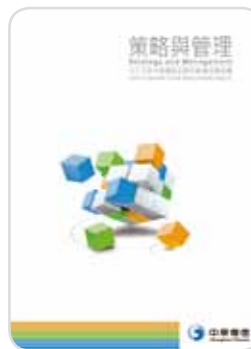
九十九年 企業社會責任報告書 2012年2月出版