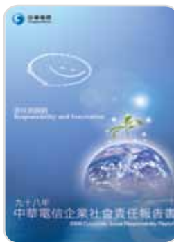
九十八年 企業社會責任報告書 2010年8月出版