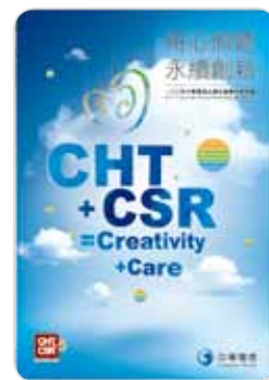
一〇〇年 企業社會責任報告書 2012年8月出版